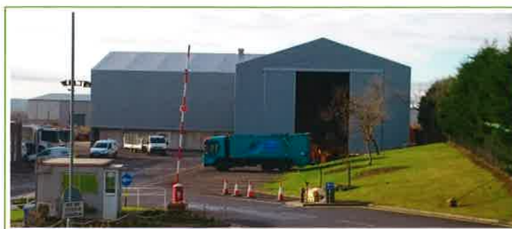
Hackworth, skladiščna hala, Velika Britanija