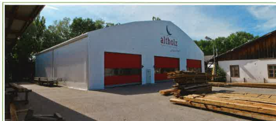
Baumgartner Altholz, skladišče lesa, Avstrija