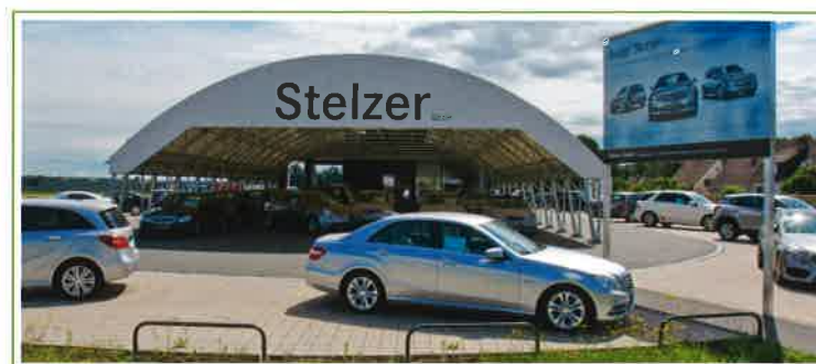
Stelzer, prodajni paviljon, Avstrija