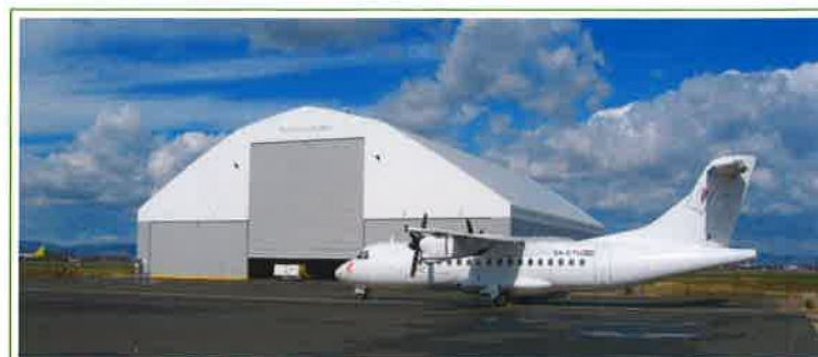
Croatia Airlines, hangar, Hrvaška