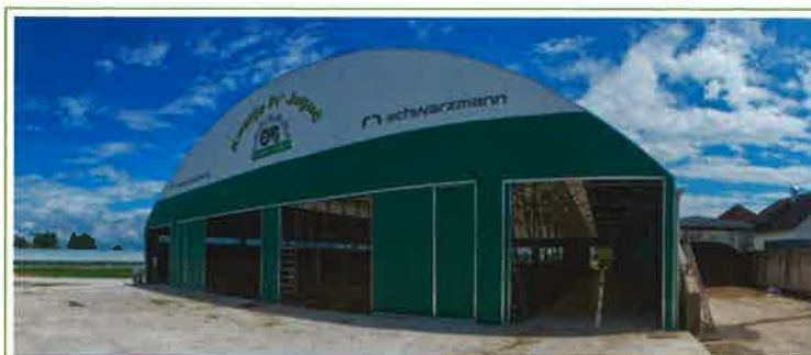
Agro Jenko, hlev, Slovenija