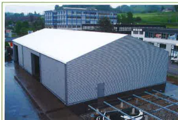
SAK, panelna hala, Švica