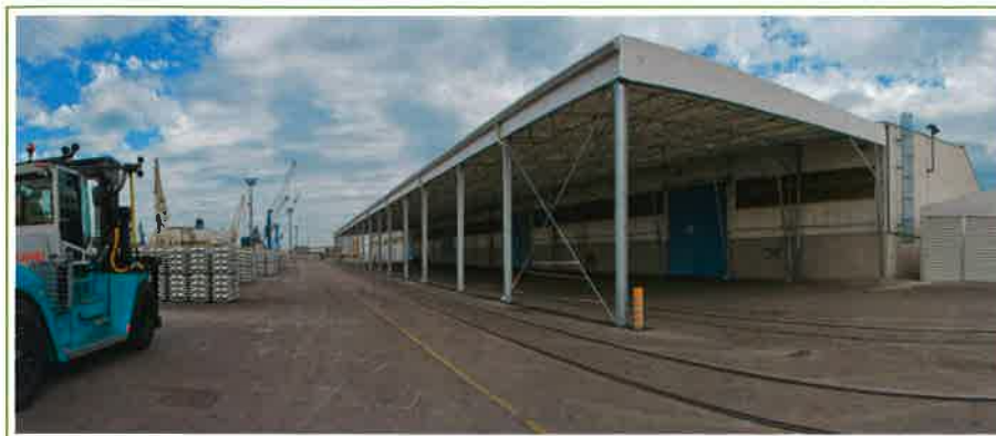
Luka Koper, nadstrešnica za logistiko, Slovenija