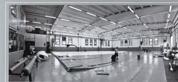
Hala za varjenje ponjav, proizvodnja Polhov Gradec, Slovenija.

"Vsi nabavljeni materiali so deklarirani po EU standardih in jih kupujemo od proizvajalcev v Italiji, Avstriji, Franciji in drugje v EU oz. od trgovskih podjetij v Sloveniji. Zanesljivi dobavitelji s kvalitetnimi materiali so naši dolgoletni partnerji."