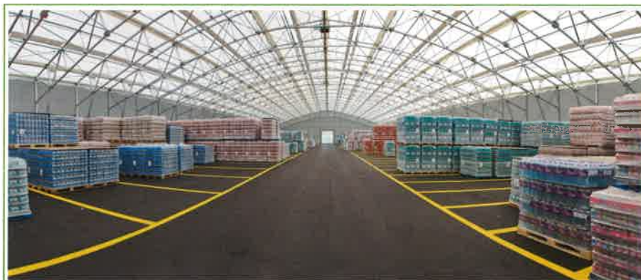
Vöslauer Mineralwasser, odpremno skladišče, Avstrija