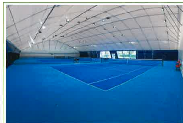
ŽTK Maribor, teniška dvorana, Slovenija