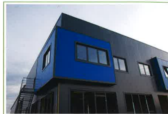
Finakos, dvoetažna panelna hala s pisarnami, Slovenija